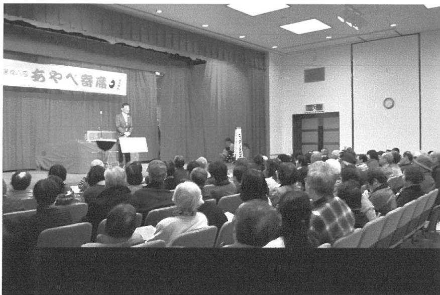
ビックリツカサ様